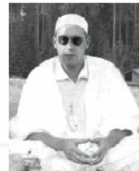
Cheikh al-'Alâwî (Algérie), Algérie, 2013

« C'est dans l'équité et la justice que l'on trouve le bonheur des individus et des groupes ainsi que l'apaisement même de la chute et de l'instabilité. [...] L'islam nous enseigne que tous les peuples sont frères malgré les différences de langue, de culture et de religion. Nous devons nous tous être frères parents et le bien-être de ce parent ne se fait qu'en la fraternité, l'amour, les bonnes relations sociales et non pas la haine, le mépris, ni l'animosité entre les peuples. Si dans le monde régnaient de bonnes valeurs qui sont l'amour et la fraternité, il y aurait une bonne entente, coopération et entraide pour le bien de tous. On évitait ainsi les conflits, les guerres et beaucoup de catastrophes qui sont causées par le manque de coopération, qui sont causées par le manque de coopération, qui sont causées par le manque de coopération, qui sont causées par le manque de coopération. »