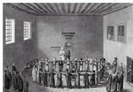
Conférence de l'UNESCO, Algérie, 2013

« Les croyants sont semblables à un seul corps ; si l'un de ses organes est malade, tout le corps est atteint par l'infection. » (Coran, Al-Baqara, 22)