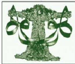
Colloque de l'UNESCO, Algérie, 2013

« L'homme est à la société ce que le membre est au corps. Les hommes, malgré leurs différences constituent une vérité unique ; être humain est par rapport à la société comme le membre par rapport au corps : les membres diffèrent entre eux par leur forme, mais on ne peut se dispenser d'avoir l'un et l'autre ou quel qu'il soit sans gêner le corps. »