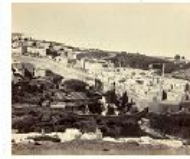
Mostaganem (Algérie), fin du XIX ème siècle, début du XX ème

Penseur, écrivain, journaliste et réformateur, ce "Sâïd soufi du XX ème siècle" comme l'appelle Mehdi Lingas, est l'un des principaux initiateurs du dialogue interreligieux du siècle dernier et une figure de proue de la lutte contre tout obscurantisme et tout extrémisme.