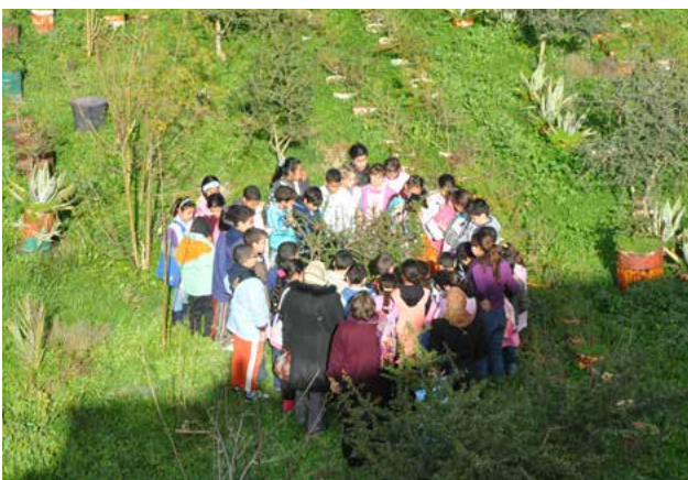
Des enfants autour d'un arganier, Centre de la Fondation Djanatu al-Arif