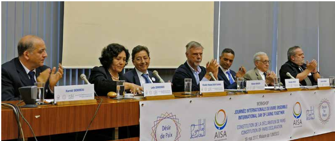
Workshop Journée Internationale du Vivre Ensemble, 19 mai 2017, Maison de l'UNESCO, Paris

La JIVEP constitue un engagement fort au sein de la famille humaine, conjuguant les notions de citoyenneté, de pluralisme, d'humanisme et de spiritualité. Elle propose une dynamique de Paix et lance son message aux citoyens du monde afin de construire une société fondé sur le respect du vivant : Vivre Ensemble, c'est Faire Ensemble. Cette journée présentée par l'Algérie a été adoptée par consensus le 8 décembre 2017 à l'ONU et sera désormais fêtée le 16 Mai dans 172 pays dans le monde.