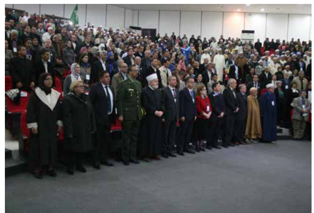
Ouverture solennelle du festival de la Journée Internationale du Vivre Ensemble, à l'Université Abdelhamid Ibn Badis. Organisé par La fondation Djanatu al-Arif en 2015