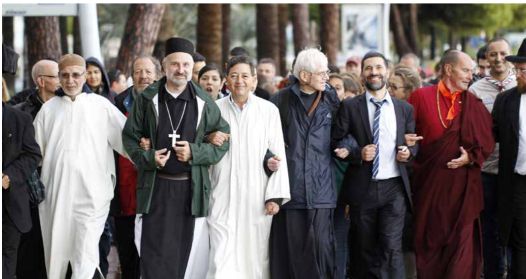
Troisième Festival du Vivre Ensemble. Construisent la fraternité et cheminent ensemble vers la paix. Cannes, 2013.