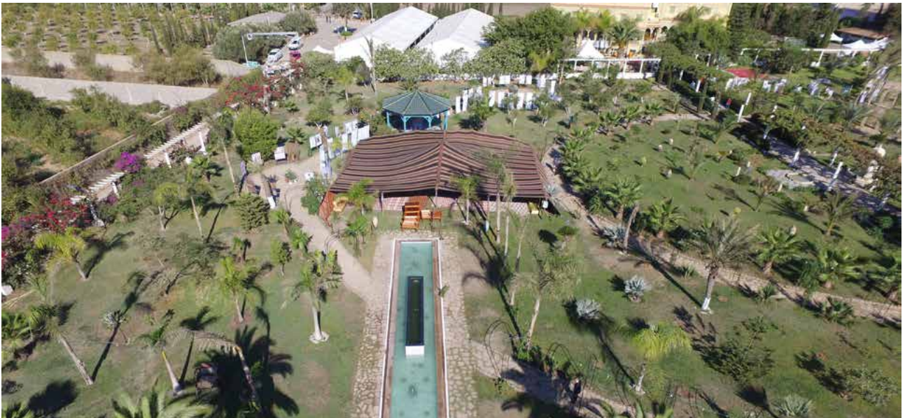
Centre de la Fondation Djanatu al-Arif, Mostaganem (Algérie)