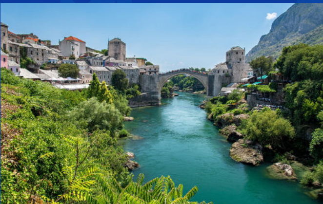
Pont de Mostar : Icône des Balkans, reliant culture et histoire à travers les siècles.