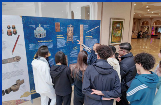
Hammamet, Tunisie 2023