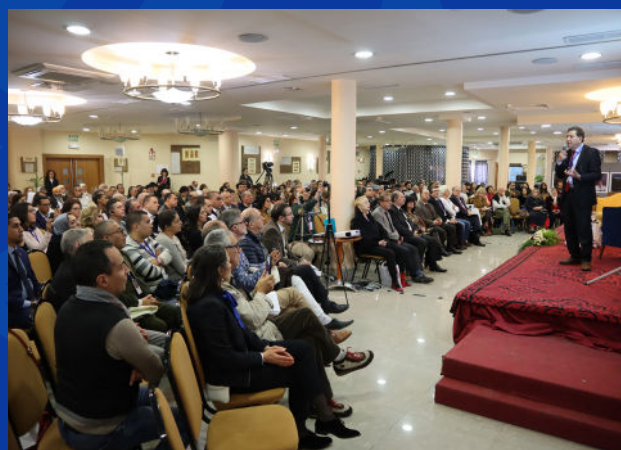
Murcia, Espagne 2018