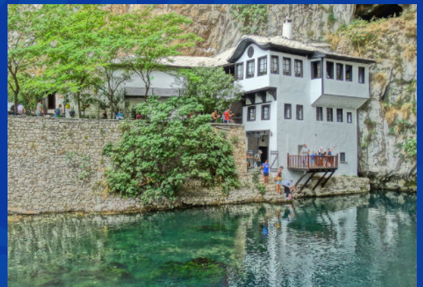
Tekke de Blagaj : Havre spirituel niché au bord de la source de la Buna, témoin du soufisme en Bosnie.