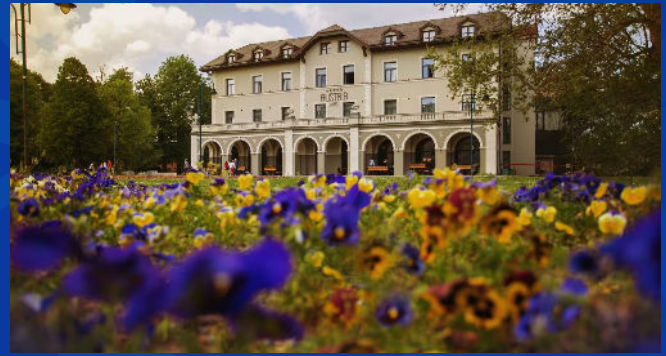
Lieux d'accueil de la Rencontre avec l'islam soufi des Balkans et ses ateliers