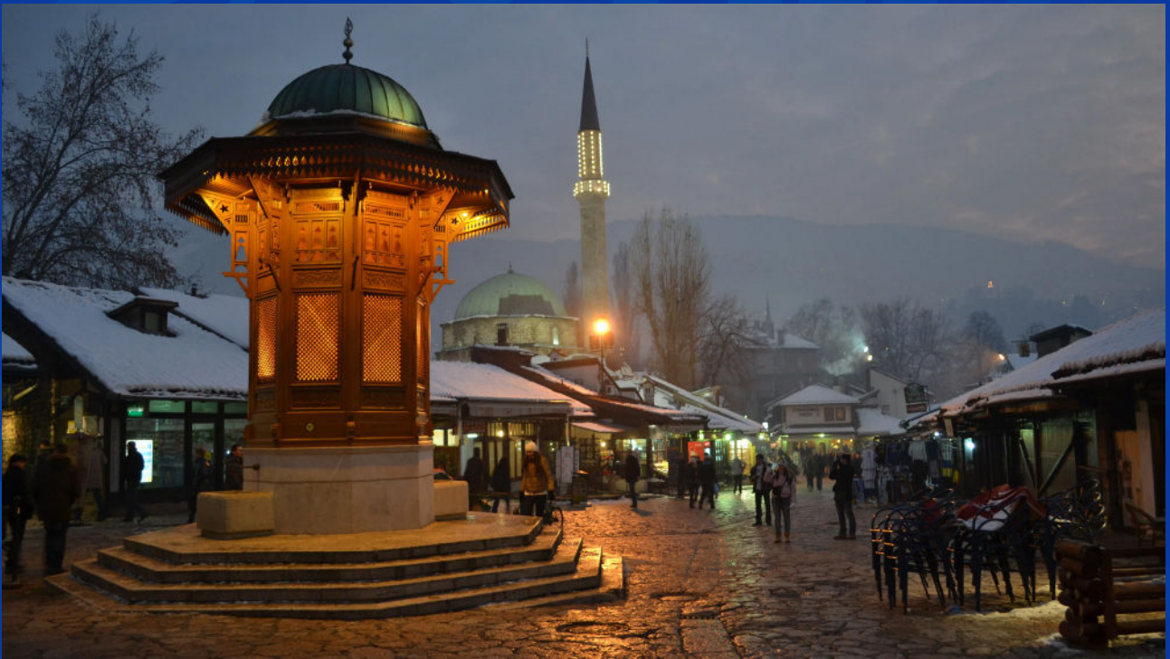
Fontaine Sebilj, Sarajevo : Symbole emblématique de Sarajevo, cœur de son patrimoine historique.