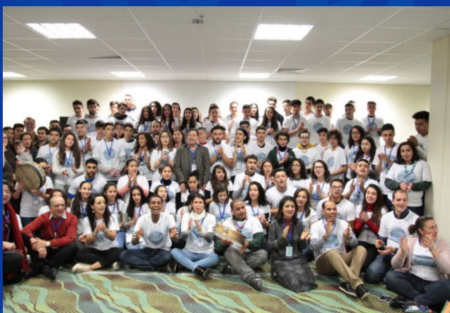
Mandelieu-la-Napoule, France 2017

En 2024, le choix s'est porté sur Sarajevo en Bosnie-Herzégovine pour aller à la rencontre de l'Islam soufi des Balkans.