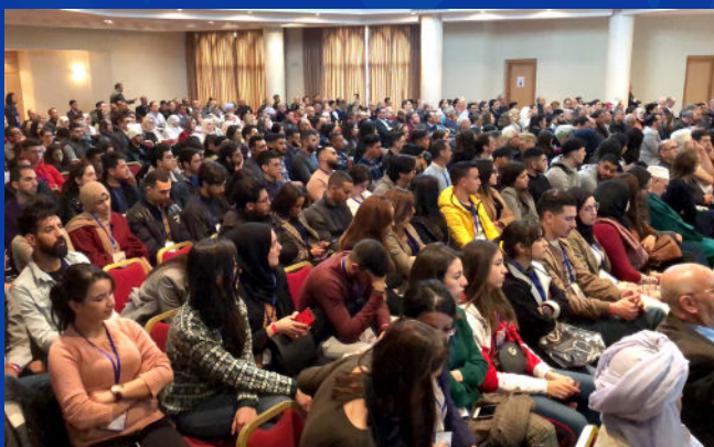
Hammamet, Tunisie 2019