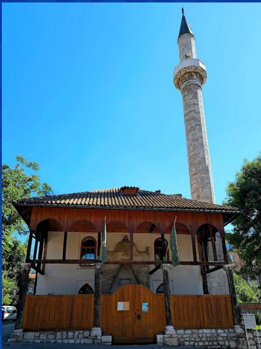
Mosquée Şeyh Mağribi, XVI e siècle, située dans la vieille ville de Sarajevo, nommée en hommage à un cheikh maghrébin.