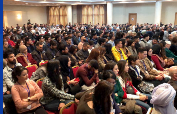
الحمامات، تونس 2019