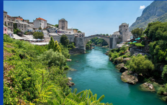
جسر موستار، أيقونة البلقان التي تربط بين الثقافة والتاريخ عبر القرون