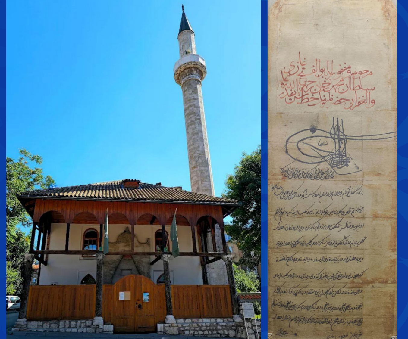
مسجد الشيخ المغربي، القرن السادس عشر يقع في المدينة القديمة في سراييفو وقد سُمّي تكريماً لشيخ مغربي.

يسرّ الجمعية الدولية الصوفية العلاوية أن تدعوكم لمشاركة لحظات احتفالية تعزّز الروابط الأخوية مع أهل البوسنة والهرسك، واستكشاف المواقع التاريخية التي تعكس الغنى الثقافي والروحي لهذا البلد الجميل، بما في ذلك المساجد، الزوايا، المدارس، والمكتبات.