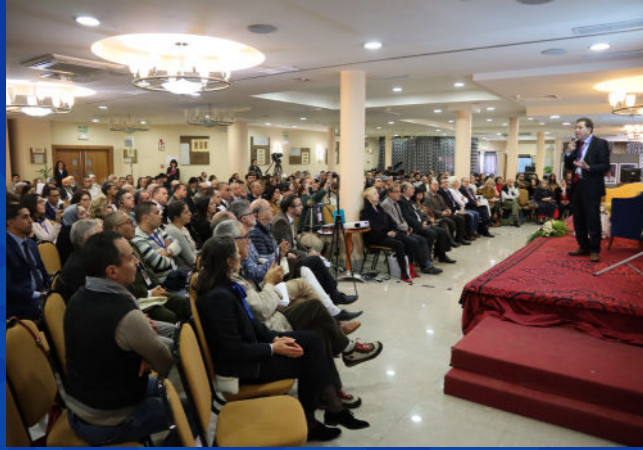
مورسيا، إسبانيا 2018

هذا العام، تم اختيار مدينة سراييفو في البوسنة والهرسك لعقد اللقاء السنوي، بهدف التعرف على الإسلام الصوفي في منطقة البلقان.