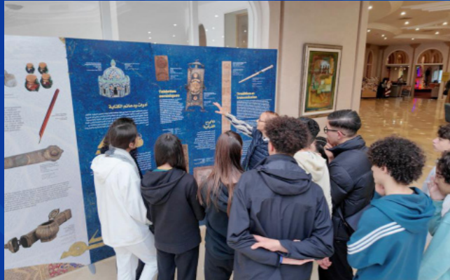
الحمامات، تونس 2023