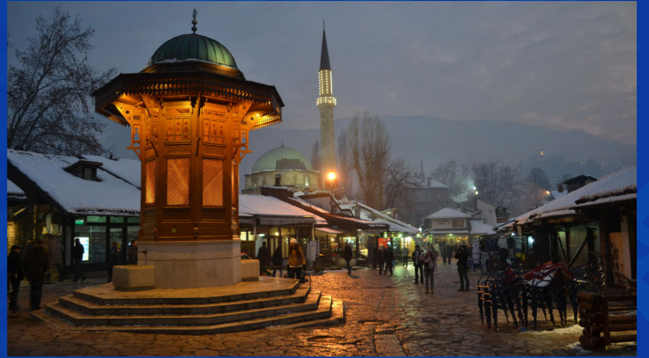
نافورة سيبيلاج، سراييفو، رمز تاريخي في قلب مدينة سراييفو