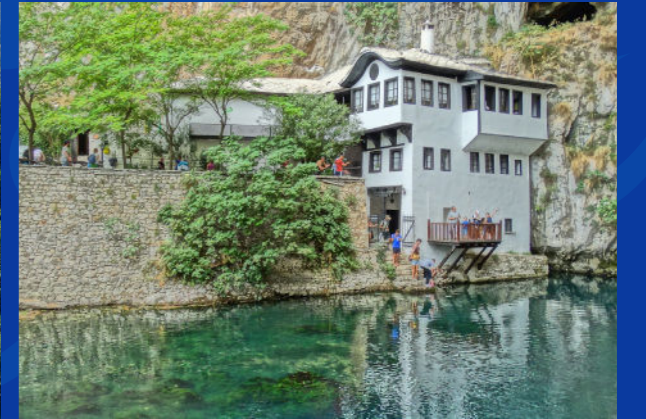
التكية (زاوية) في بلاجاي، ملاذ روحاني يقع على ضفاف نبع بونا، شاهد حي على الصوفية في البوسنة والهرسك