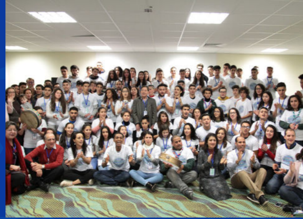
مانديليو لا نابول، فرنسا 2017